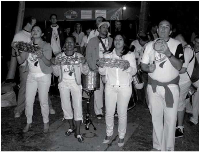
Ambiance brésilienne dans la forêt sundgauvienne