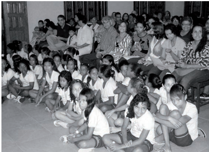
130 personnes, sans compter les enfants, à la découverte de Terre des Hommes Alsace

au local à Rixheim. Pour une fois je ne servais que de chauffeur et j'ai délégué l'activité physique. Un samedi matin elle a rencontré et soutenu l'équipe de la vente de vêtements de Rixheim. L'après-midi elle a chargé la camionnette pour le marché aux puces de Zillisheim, et le dimanche réveil à 5 heures du matin. Arrivé à notre stand il fallait déballer le tout, vendre toute la journée, remballer les invendus, retourner au dépôt pour ranger tout cela et enfin faire les comptes : 120 € pour une telle journée chargée ! Notre chère amie a versé quelques larmes en imaginant la montagne de travail nécessaire pour « son » budget, alors qu'elle a conscience que nous soutenons de nombreux projets dans les divers pays où nous sommes présents. Elle a rencontré le conseil d'administration ainsi que les personnes qui m'avaient déjà accompagné au Brésil et bien sûr elle a fait un peu de tourisme. Le jeudi de l'Ascension nous sommes allés au Glacier du Titlis à Engelberg en Suisse afin qu'elle découvre la neige et apprenne la sensation du mot « froid ». Froid que nous les bénévoles connaissons bien, lors des marchés de Noël par exemple!