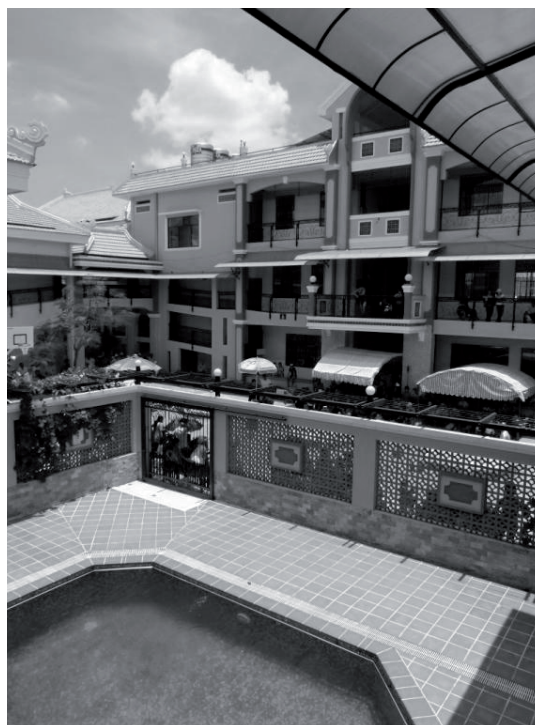
Village Chance et son bassin de balnéothérapie