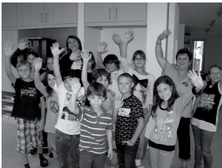
Merci à toutes les écoles et les personnes qui les encadrent pour leur implication essentielle

Elle a participé aux ramassages de vêtements dans nos divers points de collectes avant de les décharger