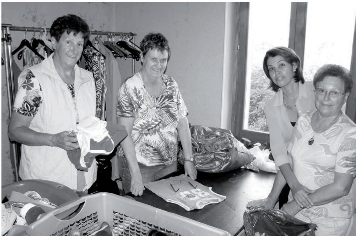
La vente de vêtements usagés - volet important de notre aide locale