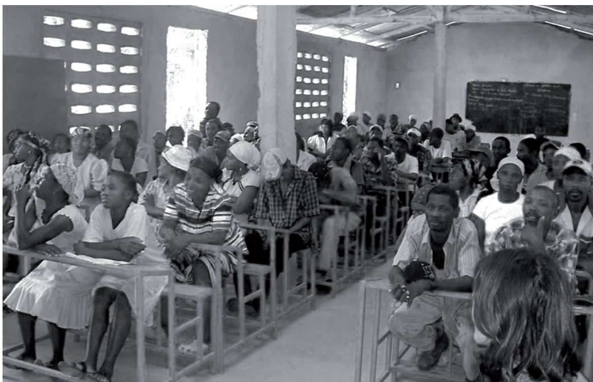
Les écoles organisent 4 assemblées de parents en moyenne par an

Comme pour les écoles des sections rurales de Boucan Carré, le projet créera les conditions d'une mobilisation concrète et transférera à la collectivité les compétences lui permettant de prendre en charge elle-même cette amélioration.