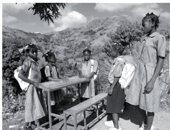
Les élèves acheminent les bancs conçus et fournis par le projet

Rappelons que TDH ALSACE est aussi engagée dans un vaste programme de scolarisation dans la zone de Petit Goâve (voir carte) et dont nous vous rendrons compte dans le prochain bulletin.