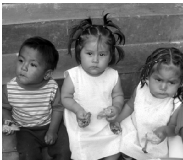
On reprend des forces

n'a pas les structures de locaux distincts garçons/filles donc ils sont reçus dans un autre établissement. Nous vérifions également la comptabilité de l'orphelinat et notamment l'utilisation des fonds que Terre des Hommes Alsace envoie : rien à dire si ce n'est que tout est clair et bien tenu.