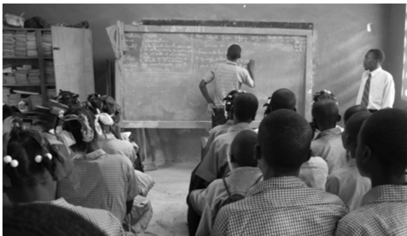
Formation pratique des enseignants