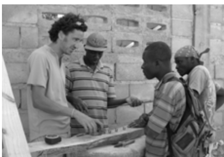
Formation professionnelle -maçons

Ma visite aux programmes que Terre des Hommes Alsace soutient en Haïti avec Inter Aide et la Fondation de France fera l'objet de mon article dans le prochain bulletin. Je serai très attentif à être un lien entre les Haïtiens et vous les donateurs.