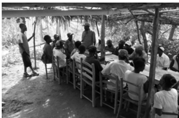
Réunion des représentants de la communauté

Le but de ces réunions est la rédaction d'une charte qui engage les parents à respecter un certain nombre d'obligations : fréquentation régulière des enfants, paiement des écolages... Les parents, informés de l'importance de l'accès à l'éducation deviennent responsables de sa mise en place puis de sa viabilité. Ils participent à l'achat des fournitures pour les élèves et le salaire de maîtres, à la fourniture de matériaux locaux pour la construction des écoles... Elus locaux et représentants du Ministère de l'Éducation sont inclus dans le processus.