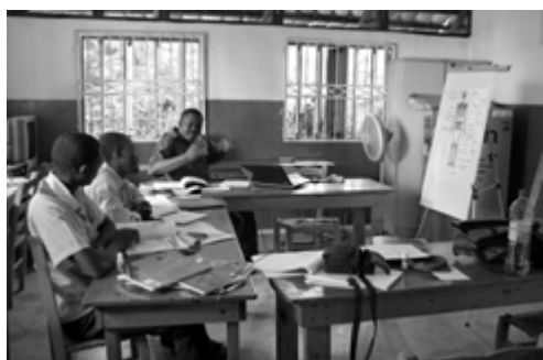
Préparation des cours

Souvent, tout est à commencer : construction d'une école, formation des maîtres. Pour cela des réunions pédagogiques sont organisées sur des thèmes spécifiques : utilisation du dictionnaire, des cartes, préparation des cours, planification du travail... Des applications concrètes sont proposées lors de cours devant une classe. Le suivi pédagogique constitue une formation continue.