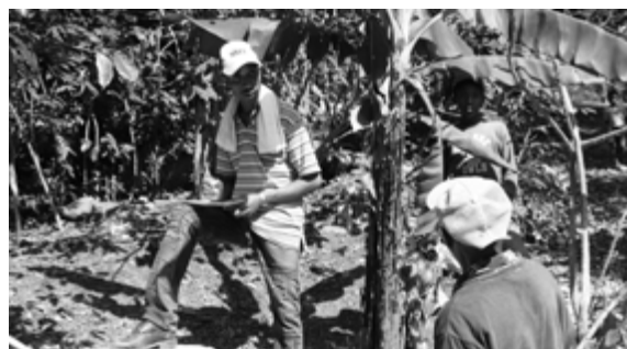
Recensement avant ouverture d'une école

L'amélioration de l'accès à la scolarisation primaire dans les zones les plus reculées et défavorisées dépend de la mobilisation des parents en faveur de la scolarisation de leurs enfants. C'est pourquoi la première opération est un recensement. Si celui-ci ne conclut pas à une demande de la population le projet ne se fera pas ! La durée théorique du soutien au projet est de 3 ans.