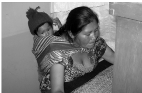
tissage : une maman en pleine action