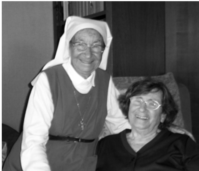
les 2 amies à Morschwiller-le-Bas