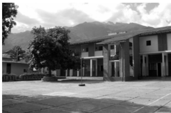
Dortoir et réfectoire des grandes