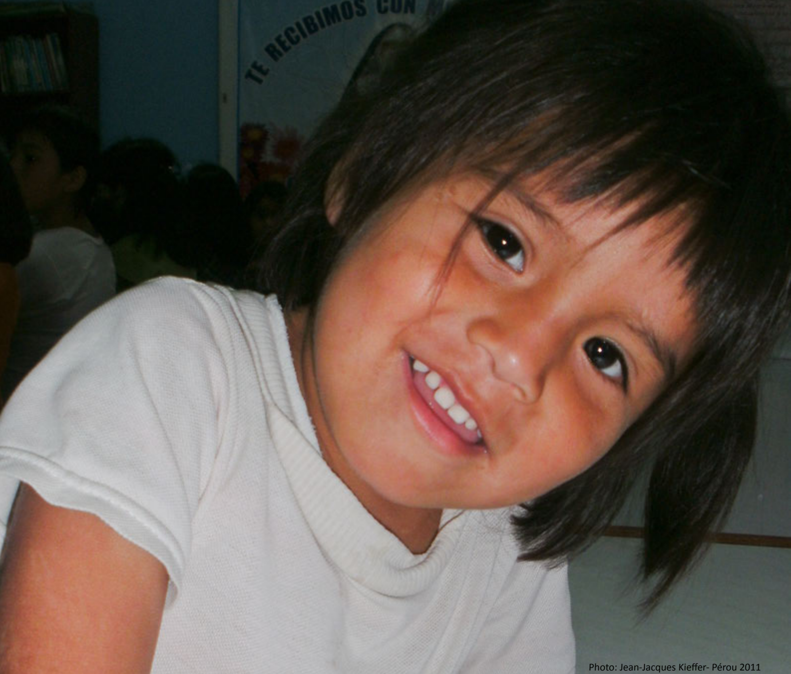
Pérou 2011