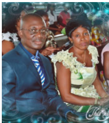
Papa et maman