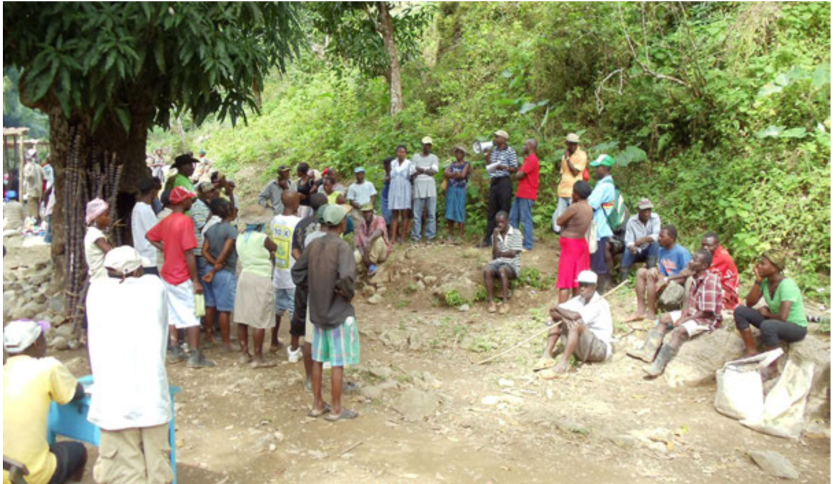
Rencontre des familles de la source Ziguée