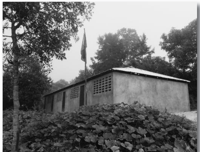
Nouvelle école de Lamielle construite en respectant les normes de base parasismiques.