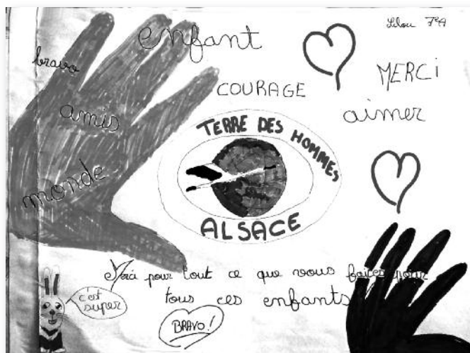
Le dessin de Lilou touchée par nos actions