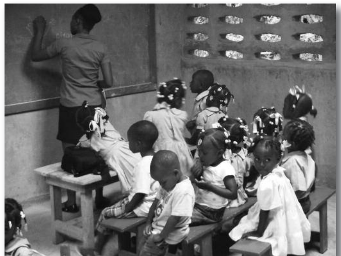
Salle de classe dans la nouvelle école de Lamielle