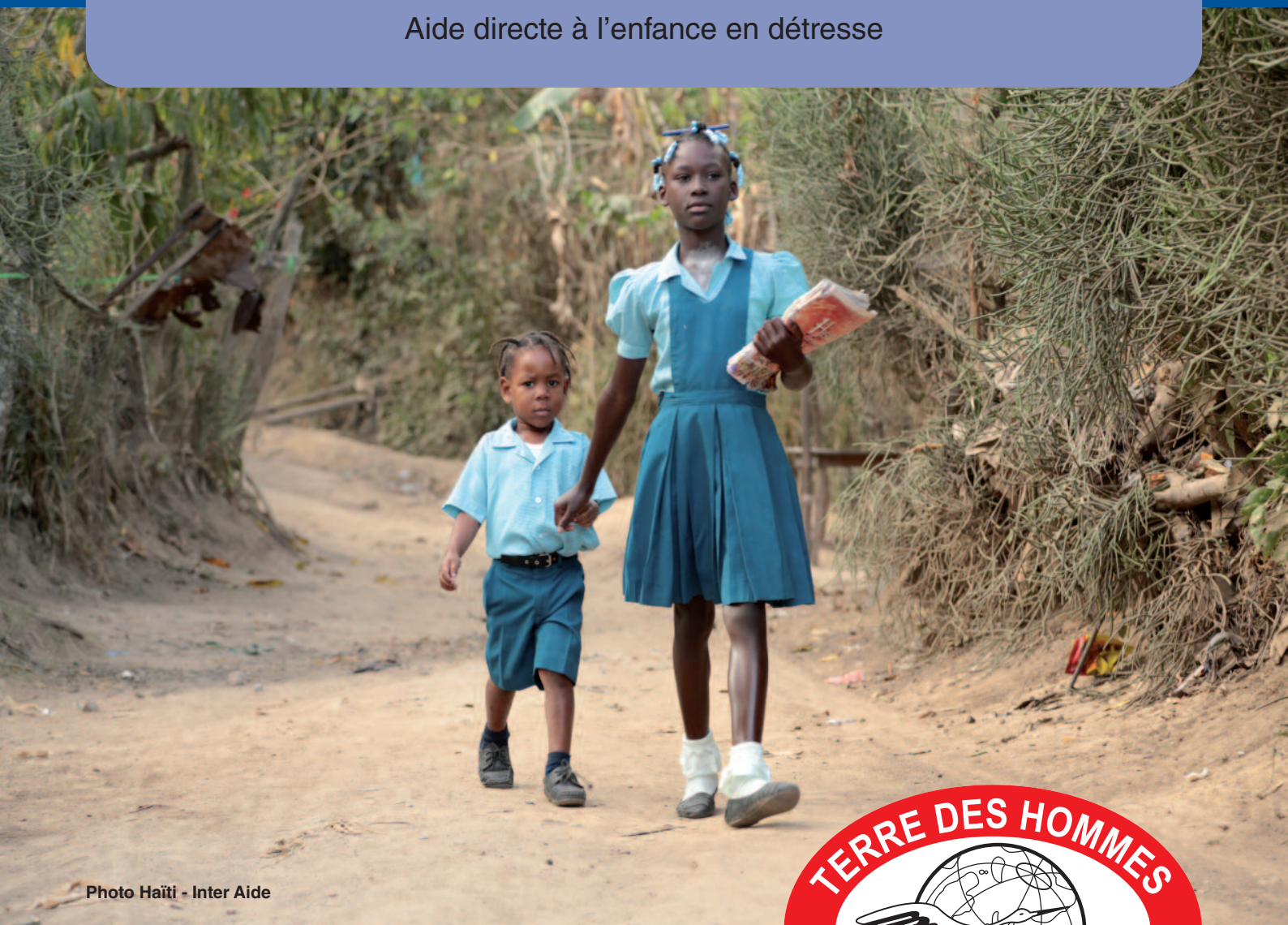
Photo Haïti - Inter Aide