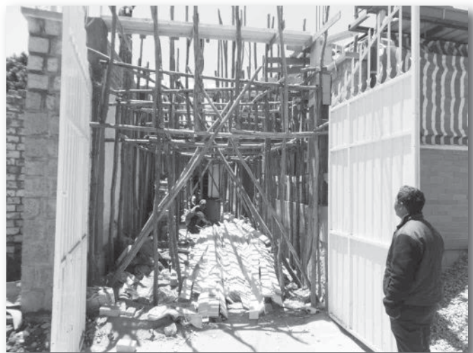
Le Dr Joro suit l'avancée des travaux