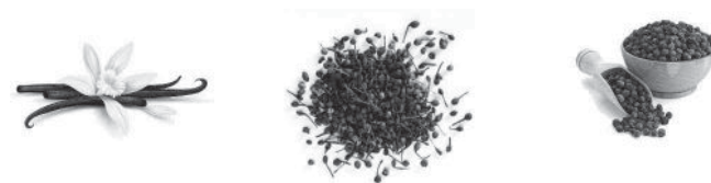
Vanille et poivre sauvage de Madagascar et Poivre du Brésil

Toujours un beau succès avec la vanille que nous présentons en tube. Cette année nous allons tenter aussi la poudre de vanille.