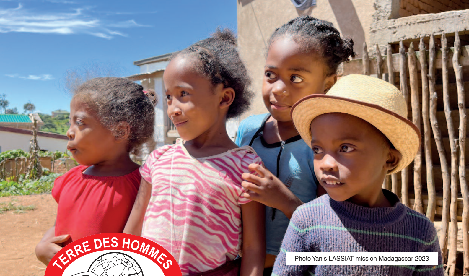
mission Madagascar 2023