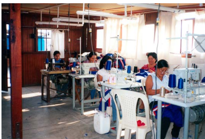
Les couturières au travail.