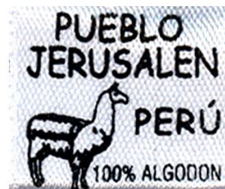
Un logo incontournable dans votre garde-robe !

Dès l'ouverture de l'atelier un premier marché est conclu, il s'agit de la fabrication des survêtements pour les élèves du collège de Jérusalem. Le bénéfice de cette prestation reste inférieur à notre objectif. Les couturières sont désappointées. La cause, une erreur de calcul dans le prix de revient. Dur apprentissage pour ces dernières car elles sont payées en fonction de leur production et du bénéfice réalisé. Des nouveaux produits sont mis sur le marché : jupe, pantalon et chemisier, qui sont essentiellement destinés au marché péruvien. Leur commercialisation se fait sur les marchés et aux bords des routes, à la criée, chose courante au Pérou. En 2007, il est prévu d'ouvrir un petit magasin à Lima. Nous avons également fabriqué un produit pour le marché français : des T-shirts en excellent coton péruvien.