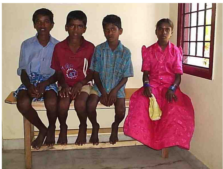
Quelques jours plus tard, c'est dans la gare routière que ces quatre enfants ont pu être sauvés des trafiquants.

Ces enfants sont obligés de travailler dans les champs pour récolter le coton à la main, 12 à 14 h par jour, sept jours sur sept, à peine nourris et pour quelques centimes par semaine. S'ils essayent de s'échapper, ils sont sauvagement battus. Tiruvannamalai et son importante gare routière sont devenus une véritable plaque tournante de ce trafic. Les agents recrutent leurs victimes dans des zones tribales ou peu éduquées à une soixantaine de kilomètres pour les conduire dans le District de Salem. Officiellement, le travail des enfants est interdit et même puni par la loi. Mais la police montre peu d'intérêt, dans le meilleur des cas, une velléité d'arrêter les