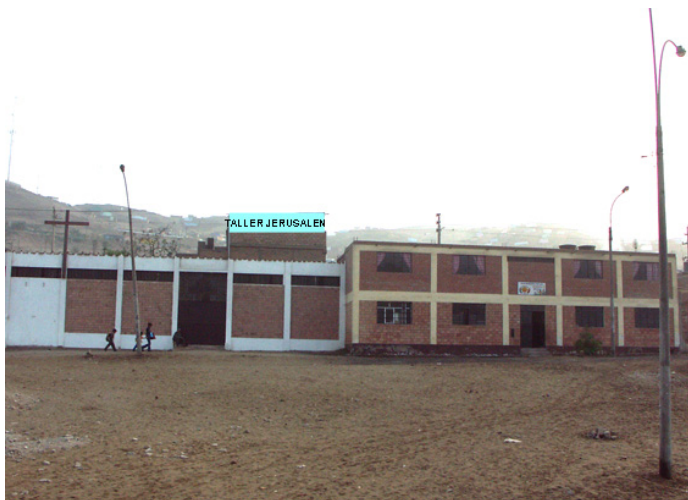
L'atelier de couture construit sur le toit de l'église.

Nous sommes en avril 2005, Terre des Hommes Alsace décide, avec le comité de gestion du programme de «Jérusalem», d'ouvrir un atelier de couture. Décision prise à la hâte tel l'enthousiasme était à son comble. Nous n'avons ni lieu où l'implanter, nous ne savons qui embaucher, quelle sera la production, et surtout les machines à coudre font défauts ! Notre unique certitude est que nous devons agir contre la pauvreté. De l'euphorie nous retombons très rapidement sur les graviers de la réalité. Pourtant, l'échec est prohibé. Nous n'avons pas le droit de décevoir la population du bidonville. Nous nous attelons à la tâche et, trois semaines plus tard, le choix des machines a été conclu, l'embauche des couturières effectuée et le lieu où sera construit l'atelier défini. Nous décidons de former le personnel aux techniques de la couture mais aussi à la gestion (calcul du prix de revient et du prix de vente). La formation durera trois mois. Pendant ce temps, l'atelier se construit pour être prêt au terme de la formation. Une prouesse ! Les délais sont respectés grâce à un suivi rigoureux des travaux par nos amies, les soeurs. Quelle chance de les avoir rencontrées. Une bonne nouvelle viendra renforcer notre engagement, une association hollandaise s'associe à nous pour l'achat des machines à coudre. Tout est prêt, le cliquetis des machines peut commencer.