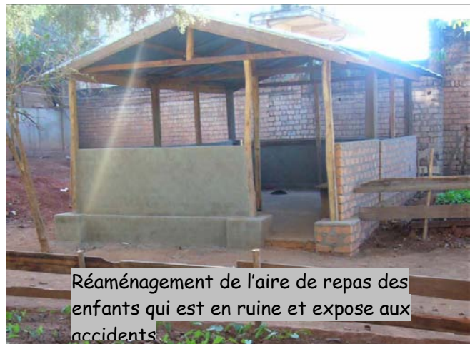
Réaménagement de l'aire de repas des enfants qui est en ruine et expose aux accidents