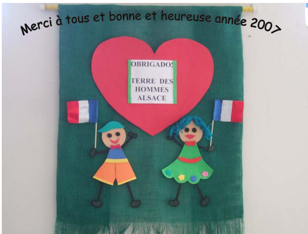
Brésil 2006