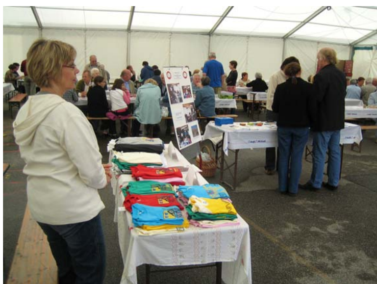
Sous la tente, la vente de T-shirts fabriqués au Pérou dans l'atelier de couture de «Jérusalén».

Merci à tous les participants, à l'équipe de bénévoles, ainsi qu'à son animateur, Auguste Waechter, qui réalisent un merveilleux travail à la grande satisfaction de tous les gastronomes et des marcheurs.