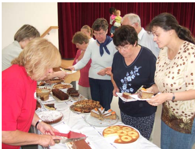
Ruée sur les pâtisseries

La météo est un facteur important pour une telle manifestation et malgré quelques passages pluvieux, 410 personnes n'ont pas hésité à faire le parcours de 11 km tout en oubliant leurs soucis quotidiens. Le parcours a été apprécié et l'ambiance que ce soit au stand tisane, en forêt ou dans la salle était conviviale. En tous cas les 110 kg de collet fumé, les 110 kg de frites, les 24 kg de saucisses, les 45 litres de soupe, les nombreuses pâtisseries prévues par l'organisation étaient épuisés et il ne restait presque plus de boissons.