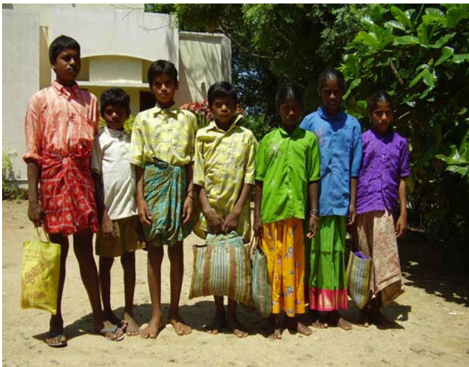
8 octobre à 23h30: sept enfants ont pu être arrachés des griffes des agents recruteurs dans un bus

Parallèlement, un autre marché est florissant: celui du trafic d'enfants. Dans le sud de l'Inde, à Tiruvannamalai où Terre des hommes Core est implanté depuis de nombreuses années, la situation devient même alarmante. Pour trouver du personnel efficace, corvéable à merci et qu'il ne faut pratiquement pas payer, les riches propriétaires terriens emploient des recruteurs. Ces agents, dont la fonction s'approche plus du souteneur, vont de village en village pour convaincre des parents illettrés de leur "prêter" leurs enfants pour quelques mois en échange de 2'000 Roupies (37 €). Ils arrivent même à obtenir une décharge signée (tout à fait illégale) de ces gens qui se laissent convaincre que leur fille ou leur fils de 12 à 14 ans va ainsi connaître un avenir meilleur.