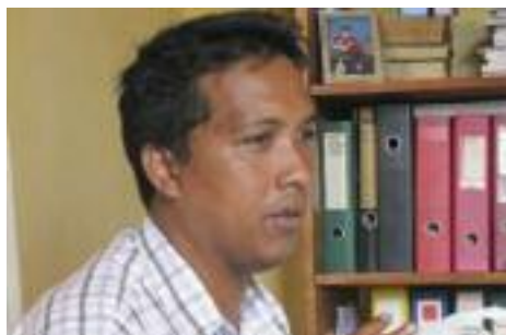
Docteur Joro responsable des projets à Madagascar

Madagascar compte parmi les pays les plus pauvres de la planète : 77% de la population vit en deçà du seuil de pauvreté, avec moins d'1,50 € par jour.