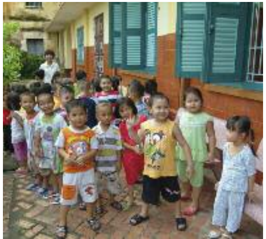
Congrégation de la Providence de Portieux

SOCTRANG Soutien à 20 jeunes filles d'origine khmer habitant dans des villages éloignés et dont les parents d'une grande pauvreté n'ont pas les moyens de subvenir à leurs besoins élémentaires et de scolarité. Logées au sein de la Communauté des Soeurs de Soctrang, elles fréquentent les écoles publiques. Elles ont un très bon degré d'instruction.