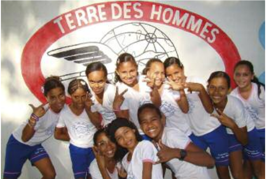
Projet de jeunes filles des rues Belmonte Bahia Brésil