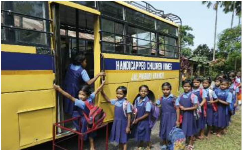
Jeunes filles handicapées prêtes pour l'école Howrah South Point Jalpaiguri INDE