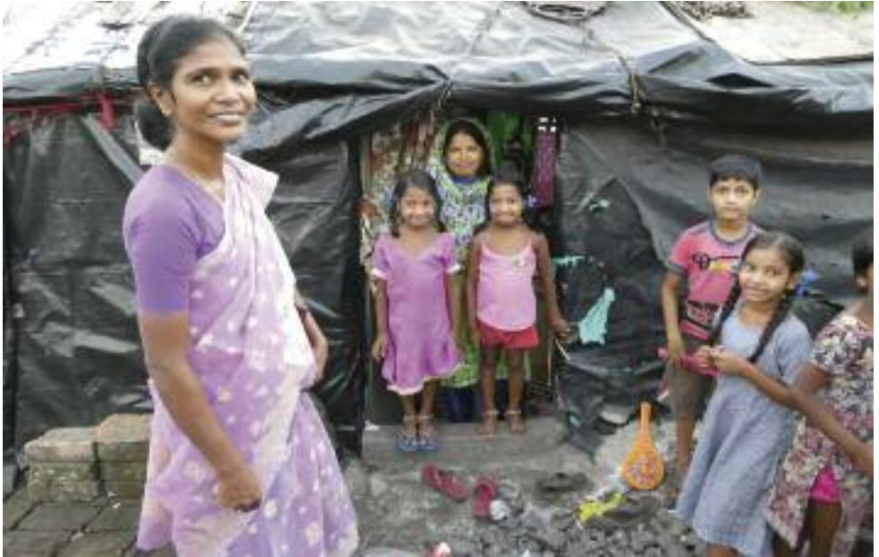
Visite dans un bidonville les enfants sont soutenus par la Congrégation Our Ladies of the missions Calcutta Inde