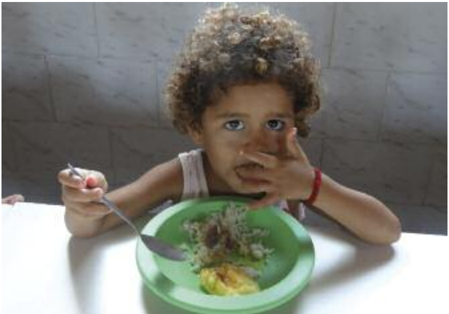
Repas Crèche Cristo Redentor Salgueiro Pernambouc Brésil